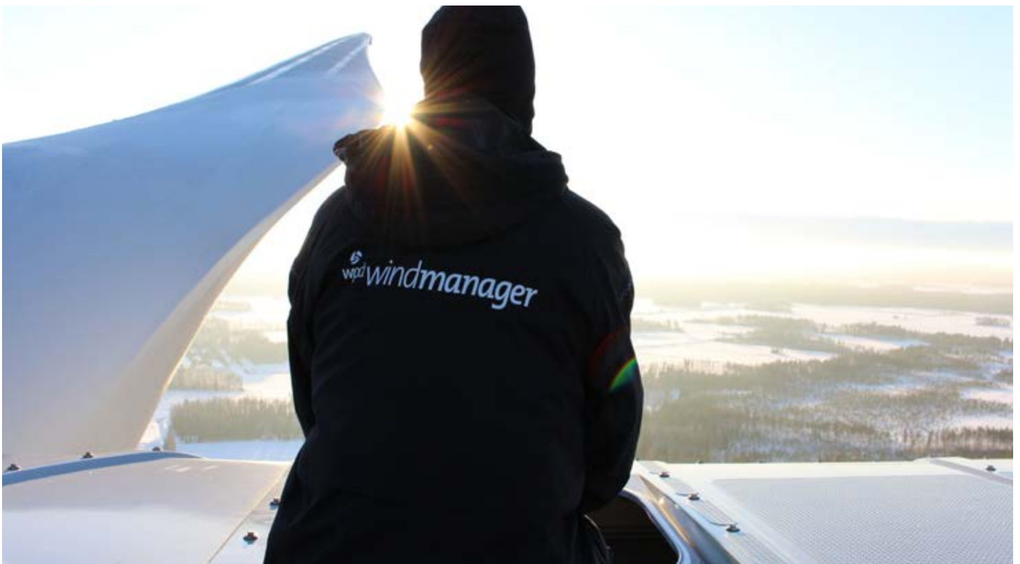
Bild: Anforderungen an den Betrieb von Windparks steigen enorm

Schreiben Sie uns Ihre Fragen und Themenwünsche: redaktion@pmwindenergy.de