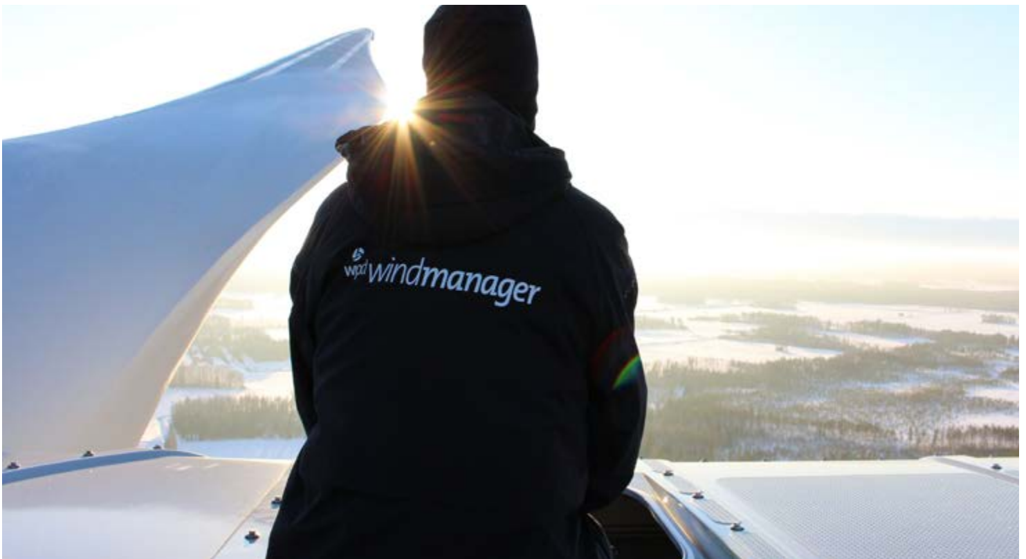
Bild: Anforderungen an den Betrieb von Windparks steigen enorm

Schreiben Sie uns Ihre Fragen und Themenwünsche: redaktion@pmwindenergy.de