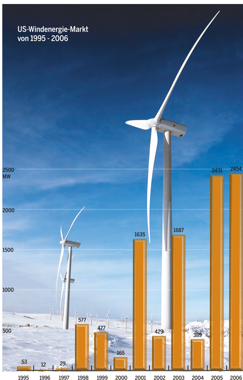
In den USA erlebte der Windenergiemarkt enorme Schwankungen, bedingt durch das Stop-and-go der Förderpolitik.

Windturbinen müssen in den USA auch gegen eisige Temperaturen gewappnet sein. Das Foto zeigt eine Vestas V80-1.8 im Windpark Everton.